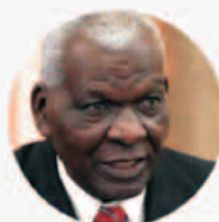
Juan Esteban Lazo Hernández Presidente