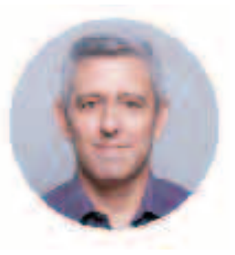
JORGE LUIS PERDOMO DI-LELLA Viceprimer Ministro y Ministro de Economía y Planificación