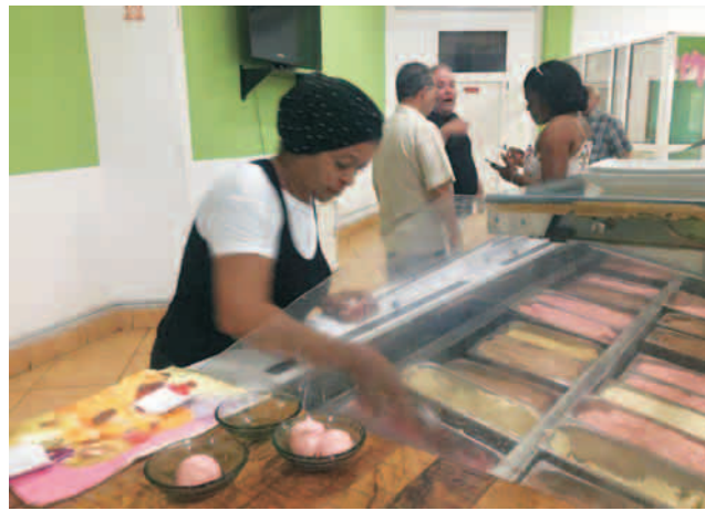
Cremería de Garzón y K