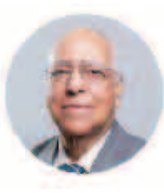
RICARDO CABRISAS RUIZ Viceprimer Ministro y Ministro del Comercio Exterior y la Inversión Extranjera