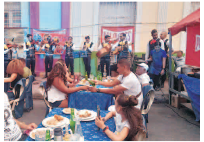
Área de Palmares