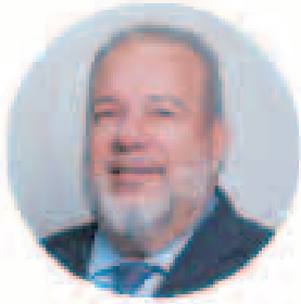
MANUEL MARRERO CRUZ Primer Ministro