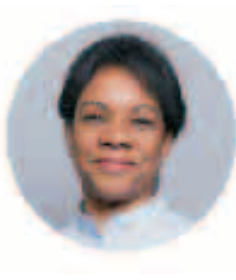
INÉS M. CHAPMAN WAUGH Viceprimera Ministra