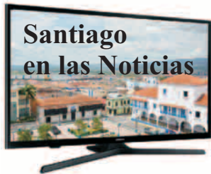
Angela Santiesteban Blanco angela.santiesteban @nauta.cu