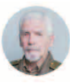
RAMIRO VALDÉS MENÉNDEZ Viceprimer Ministro