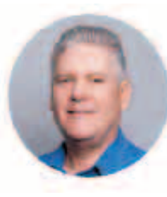
ALEJANDRO GIL FERNÁNDEZ Viceprimer Ministro y Ministro de Economía y Planificación