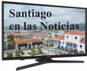
Angela Santiesteban Blanco angela.santiesteban @nauta.cu

BUENOS días, estoy segura de que hoy están descansando después de haber participado en el multitudinario desfile por el Día de los Trabajadores y de haber participado en las actividades festivas programadas para la ocasión, las que se extienden a este fin de semana, entre las que están los bailables en las áreas tradicionales, así como las propuestas del INDER que incluye un juego de pelota entre dos generaciones de peloteros. Escoja entonces la de su preferencia y disfrute al máximo después de haber aportado su granito de arena para continuar desarrollándonos a pesar de las difíciles condiciones económicas por la que atraviesa el país como