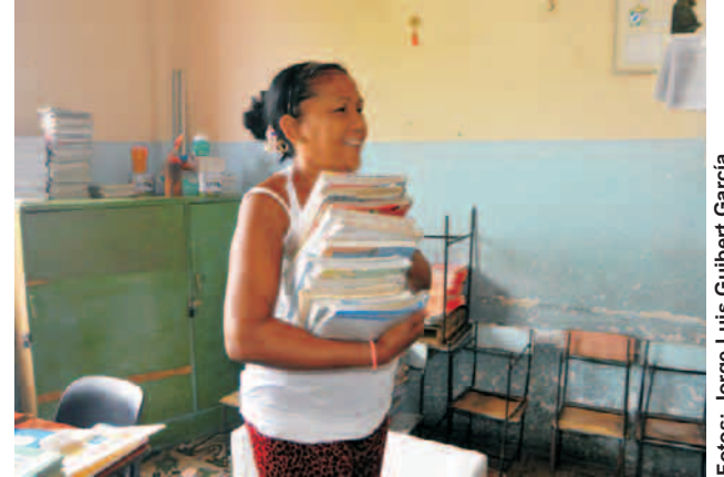
Se alista la Base Material de Estudio en la escuela primaria 'Nacho' Martí

El acto provincial de inicio del curso escolar 2019-2020, está previsto celebrarlo en el IPU Cuqui Bosch.