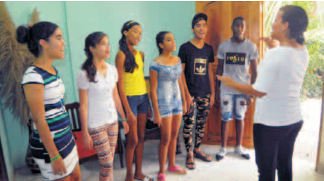
Alumnos de la Secundaria Básica Orlando Fernández ensayan matutino de inicio de curso