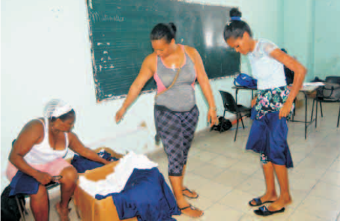
Entrega de los uniformes a estudiantes de formación pedagógica en la escuela Pepito Tey