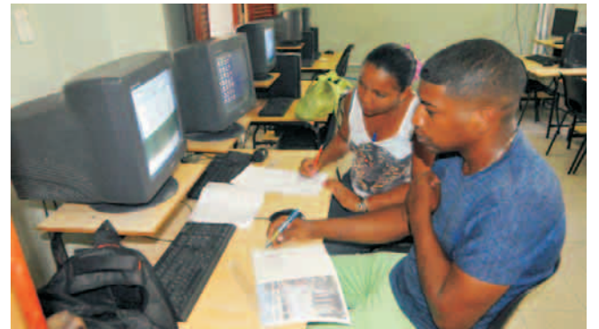
Profesores del territorio se autopreparan para el nuevo período lectivo