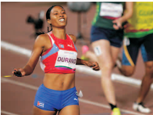
Omara ganó las tres pruebas en las que se presentó

"Nosotros salimos a dar lo máximo en cada carrera. Tenemos el compromiso de superarnos cada vez y de regresar con el mejor resultado para Cuba", declaró Durand al término de la competencia.