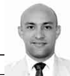
A cargo de: JORGE R. MATOS CABRALES

tiempo-extra-90.blogspot.com @MatosCuba84