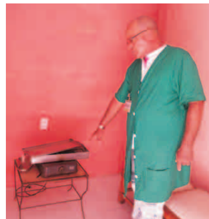
Hornilla eléctrica que sirve para esterilizar los materiales quirúrgicos

solucionarlo. "Estamos cortos de recursos, pero no dejaremos ese asunto de lado".