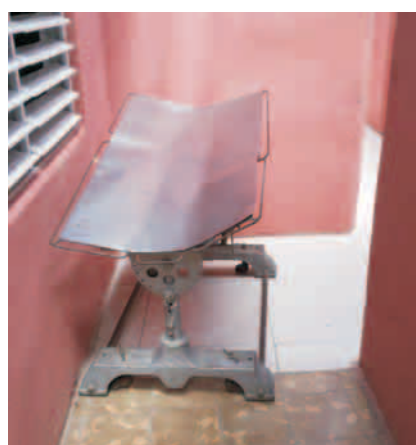
Mesa que no entra hacia el salón

En esta sala, además, se acumulan sobre la meseta varios extintores, medida muy bien pensada y digna de aplauso. Excepto porque ahí no deberían estar, sino colocados estratégicamente en las paredes del edificio. La sala de recuperación presenta la misma situación. Si se tiene en cuenta que esta parte de la instalación se pensó para ser climatizada, y por tanto no se le hicieron ventanas, trabajar ahí es imposible por ahora. Algunos fregaderos no se encuentran pegados a la meseta con ningún tipo de cemento, se hallan superpuestos nada más, lo cual significa un problema higiénico grande, por no hablar del peligro de accidentes.