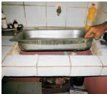
Estos son los fregaderos superpuestos