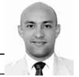
A cargo de: JORGE R. MATOS CABRALES

tiempo-extra-90.blogspot.com @MatosCuba84