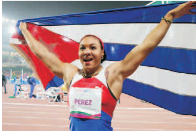
Yaimé ganó uno de los títulos más espectaculares de la delegación cubana

nuestra participación en pruebas y deportes, por las limitaciones que enfrenta la nación. Para que tengan una idea, los metales áureos fueron aportados esta vez por las disciplinas de boxeo (8), lucha (5), atletismo (5), judo (5), tiro (4), remo (2), canotaje (2), ciclismo (1) y esgrima (1), dentro de una lista de 20 que llegaron hasta el podio.