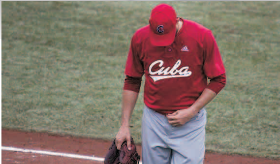
El béisbol cubano sufrió un nuevo revés, ahora en los Juegos Panamericanos Lima 2019