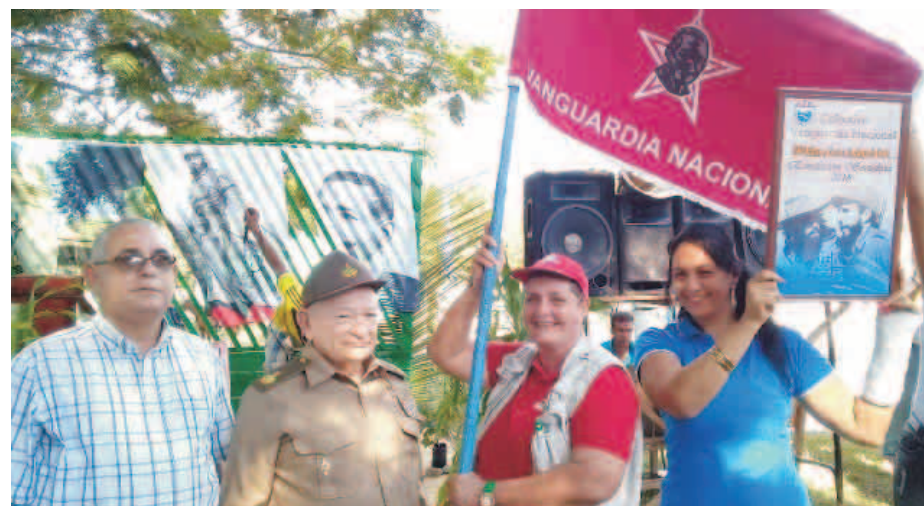
La bandera de Vanguardia Nacional fue entregada por el Comandante de la Revolución Guillermo García.

El Comandante de la Revolución Guillermo García Frías, entregó la bandera de Vanguardia Nacional de la Central de Trabajadores de Cuba (CTC) a la Empresa de Flora y Fauna de Santiago de Cuba, la cual avala los sobresalientes resultados económicos y eficiente gestión durante el pasado año.