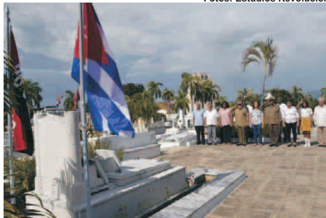
Ante el sencillo panteón de la familia País García, al conmemorarse este 30 de julio el aniversario 62 del asesinato del joven Frank y de Raúl Pujol, el General de Ejército y el pueblo santiaguero congregado protagonizaron un momento de especial emoción en recordación a los héroes

Momento de especial emoción ocurrió ante el sencillo panteón de la familia País García, al conmemorarse este 30 de julio el aniversario 62 del asesinato a plena luz del día en una calle santiaguera del joven Frank, el David de la clandestinidad, uno de los hombres más buscados entonces por los esbirros de la tiranía batistiana. Junto a él cayó acribillado su compañero de luchas, Raúl Pujol, y desde entonces se