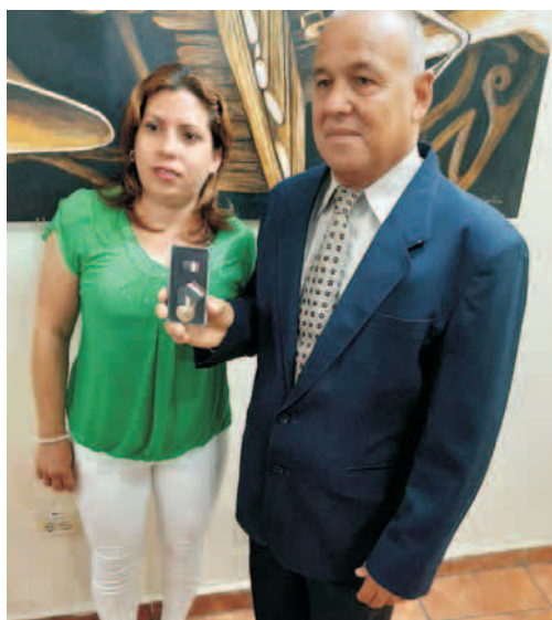
Luis Ángel Lastre contralor jefe

Al respecto expresó: "Junto al pueblo hemos tenido la responsabilidad de crear las bases organizativas, estructurales y reglamentarias, los procedimientos y las normas dirigidas hacia el ámbito interno y también las correspondientes por nuestras funciones hacia el Sistema Nacional de Auditoría, y los sujetos de nuestras acciones de control.