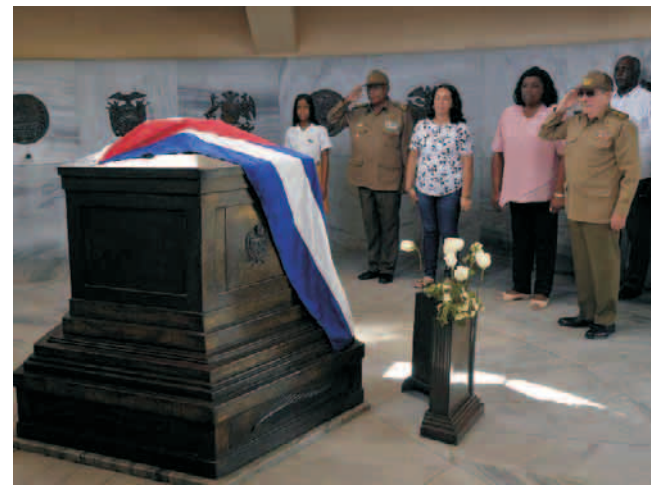
El General de Ejército, acompañado por Beatriz Johnson Urrutia, así como por otras autoridades del territorio, depositó flores ante la cripta funeraria del Apóstol

Así lo planteó Fidel el 30 de julio de 1959 en el Instituto de Segunda Enseñanza, en cuyas aulas se formaron los hermanos Frank y Josué. En consecuencia, el sentido respeto de este martes en el cementerio Santa Ifigenia, a donde también llegaron miles de santiagueros en la habitual peregrinación que cada 30 de julio estremece las calles de la ciudad heroica, es respuesta contundente: no hay olvido posible para los héroes y mártires de Cuba.