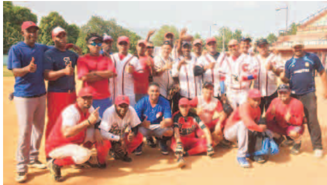
Atlético y Cultura disfrutaron de una bonita jornada de hermandad

La jornada concluyó con empate a una victoria, pero más allá del resultado, lo importante fue la confraternización entre los sindicalistas-softbolistas que encuentran en el llamado deporte de la bola blanda un espacio para salirse de su rutina laboral, con una recreación sana y saludable.