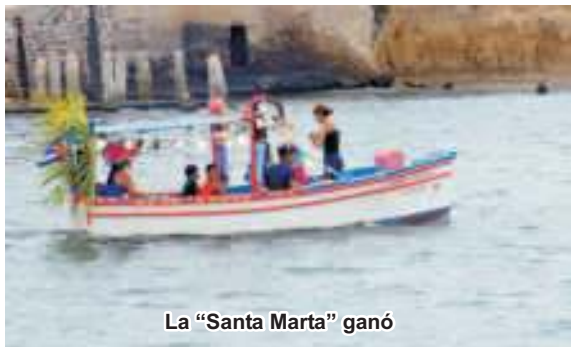
La “Santa Marta” ganó