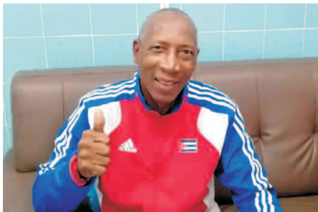
Foto: Yordanis Blanco Calderín Vinent agradeció las muestras de cariño de la afición santiaguera y cubana en general

En conversación con el director del Hospital Provincial Clínico