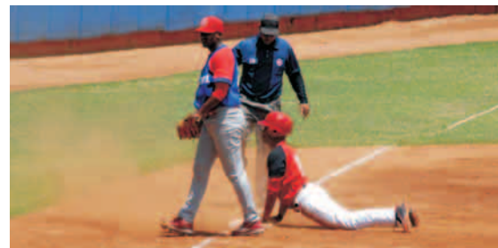
Los santiagueros llegaron sin problemas a la post-temporada

También hay que estar pendientes de que -en caso de ser necesarios- se jueguen los partidos contra Holguín, porque no sería la primera vez que se "enmarañan" estos pendientes y tal vez ahí esté la clave de los indómitos para estar más cómodos en la post-temporada. Nos vemos en el estadio.