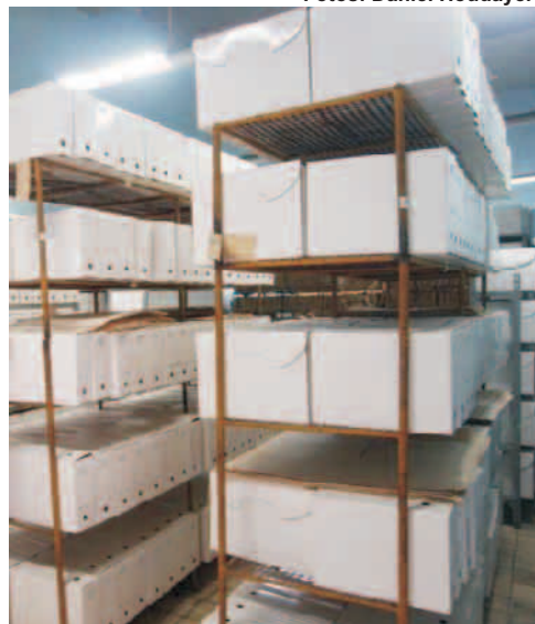
Documentos guardados en el Archivo que datan de 1664, aunque no todos presentan las condiciones adecuadas para su preservación