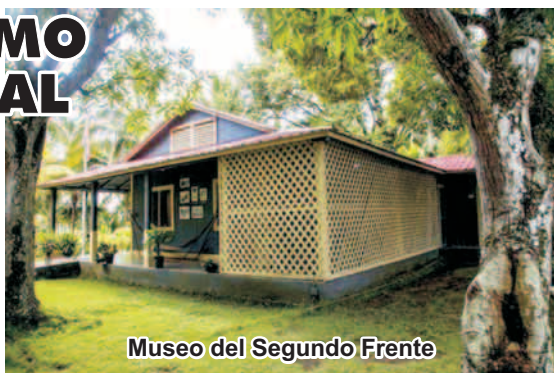
Museo del Segundo Frente