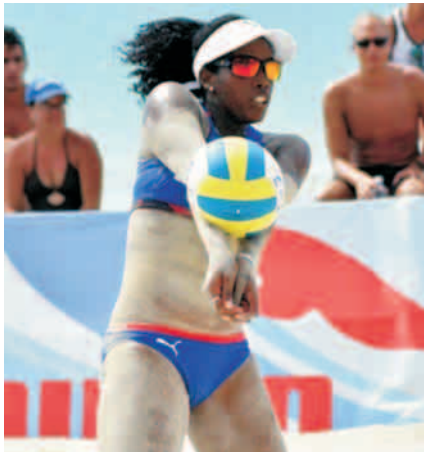
Maylen ha elevado su nivel como integrante de la pareja número uno de Cuba

elijan la más destacada en mi tierra, entre tantos deportistas de nivel mundial, es muy importante para mí. Es algo que me emocionó sobremanera, al igual que a mis familiares", destacó.