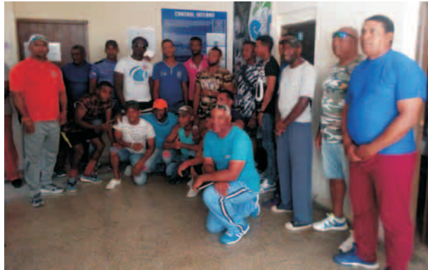
Los peloteros fueron invitados por miembros de la Peña Deportiva Roberto Ledo