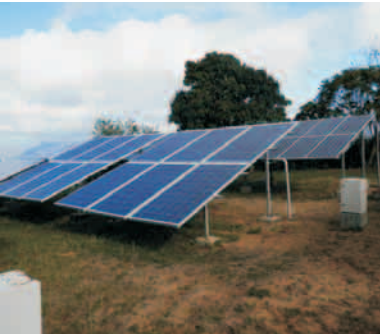
Central fotovoltaica ubicada en la comunidad de Santa María de Loreto, con más de 20 años de explotación

"Recuerdo que hicimos los primeros prototipos de secadores solares diseñados para las condiciones de Cuba. En el centro se conserva el primero hecho en el país con más de 25 años. Fue un resultado relevante a nivel nacional