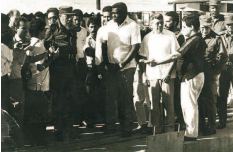
Visita de Fidel Castro al Cies en ocasión del IV Congreso del Partido celebrado en Santiago de Cuba, en 1991

tenemos y podemos manejarla como deseamos, lo que permite independizarnos un poco del mercado externo", especificó Ramos.