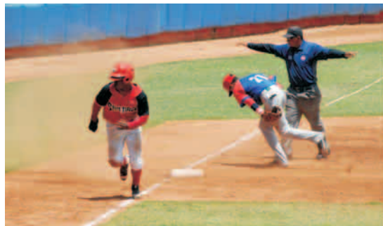
Las Avispas se han adelantado a sus rivales en la llave D

En las quintas subseries, que comenzaron ayer, el elenco de la llamada "tierra caliente" recibirá en sus predios a Guantánamo (jugarán doble hoy sábado en el "Guillermon Moncada", porque mañana domingo no habrá acción), para después (el miércoles próximo) enfrentar a los Alazanes de Granma en la Ciudad Monumento. Nos vemos en el estadio.