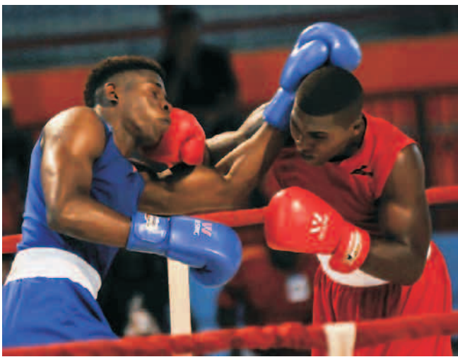
La Final de la Serie Nacional de Boxeo por equipo 2019 se desarrollará a principios del próximo mes

Allí los dueños de casa volvieron a superar la barrera de los 190 puntos y con acumulado final de 410 (191 en la primera y 219 en la segunda) dominaron cómodamente el certamen que le abrió las puertas a la disputa de las medallas, pactadas para