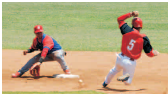
Los santiagueros tendrán que esforzarse al máximo para alcanzar la clasificación

Subseries que comienzan mañana domingo: Santiago-Holguín, Granma-Guantánamo, Pinar-Artemisa, La Isla-Habana, Cienfuegos-Mayabeque, Matanzas-Villa Clara, Las Tunas-Ciego y Sancti Spiritus-Camagüey, con los segundos de cada caso como locales.