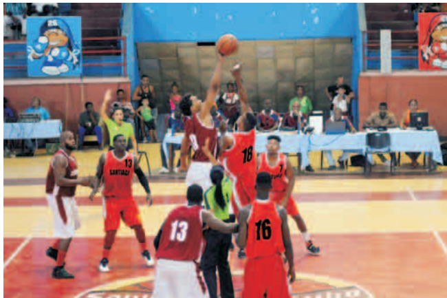
Los santiagueros se quedaron cortos en sus aspiraciones de alcanzar la Final

Por otra parte, las Mambisas santiagueras lo intentaron de todas las formas posibles, pero se sabía que tumbar a Capitalinas era una tarea más complicada que escalar el monte Everest.