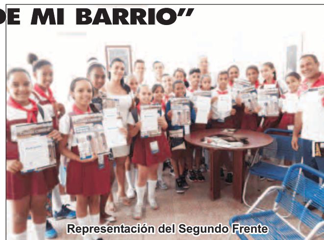
Representación del Segundo Frente