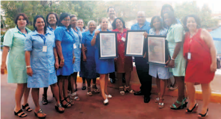
Representantes de Santiago de Cuba en el Seminario Nacional

Santiago de Cuba resultó Destacada por el trabajo durante el año 2018, junto a las provincias de Guantánamo, Granma y Las Tunas, en ocasión del Seminario Nacional de Preparación del curso 2019-2020, que contó con la presencia de Miguel Díaz-Canel Bermúdez, Presidente de los Consejos de Estado y de Ministros, y Ena Elsa Velázquez Cobiella, ministra de Educación.