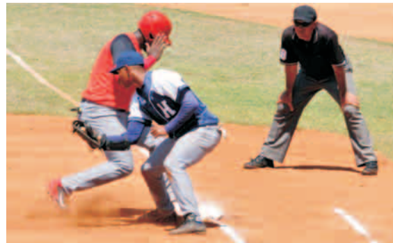
La VI Serie Nacional sub-23 no comenzó como se esperaba

Solo cinco líneas para intentar tapar una realidad. La Sub-23 ha comenzado mal, porque no solo está el gatillazo del Holguín-Santiago, también colegas de Las Tunas publicaron en la red social Facebook fotos del equipo de esa provincia, subtítular actual, en una caminata de varios kilómetros hacia el estadio por fallas en el transporte que les debía mover hacia el terreno de juego.