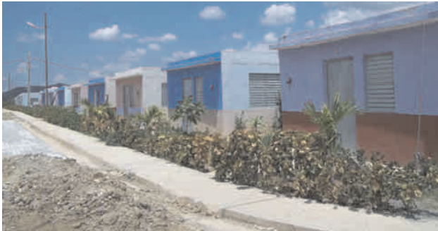
Nuevo asentamiento de viviendas mínimas de La República

Velar por la calidad de las obras y por la solución de los problemas constructivos que puedan existir, es obligación de