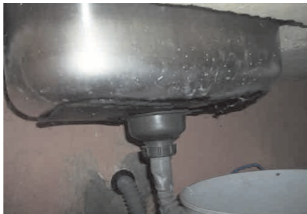
La falta de sifas impide utilizar los fregaderos en las viviendas mínimas de La República

En próximas ediciones este equipo continuará tratando el tema de la vivienda. Usted puede contactarnos por vía electrónica a cip226@enet.cu . Por lo pronto, queremos reconocer la voluntad política y los incansables esfuerzos de las autoridades del Partido y el Gobierno y del pueblo santiaguero, que se han empeñado en resarcir los daños ocasionados por "Sandy" (casi 16 000 casas parcialmente afectadas y más de 171 000 destruidas). Además, trabajan para solucionar en lo posible la necesidad habitacional de decenas de miles de personas.