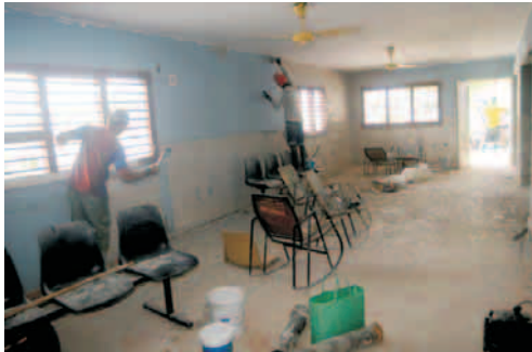
Reparan funeraria de San Luis