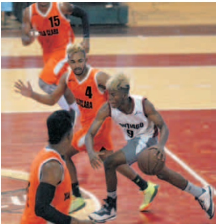
Los santiagueros siguen con paso firme hacia la clasificación

los 2 partidos a los matanceros, 67x63 y 95x64.