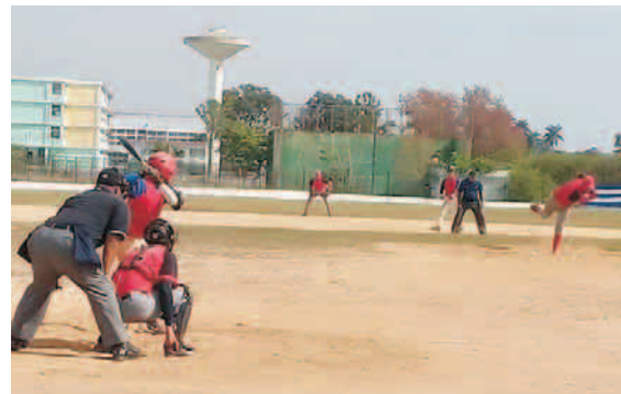
Los santiagueros supieron crecerse en los momentos más importantes del torneo

A modo de resumen, les cuento que detrás de "Santiago" y Granma se ubicaron por este orden: Camagüey, Sancti Spiritus, Pinar del Río y Matanzas.