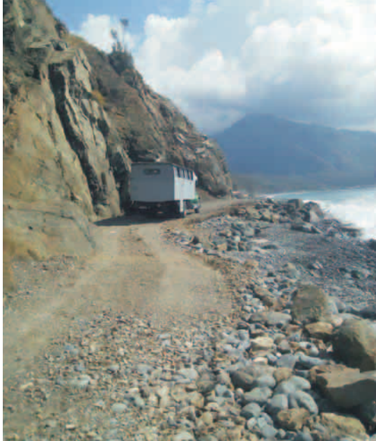
Entre el mar y la montaña