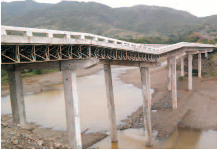
Puente de la Magdalena

los efectos del cambio climático y la necesidad de que los objetos de obras de la carretera Granma alcancen la sostenibilidad y funcionalidad en el tiempo, además de la importancia que tiene para la provincia homónima, Santiago de Cuba y el país, hacen que la ejecución avance de la mano con la Tarea Vida.