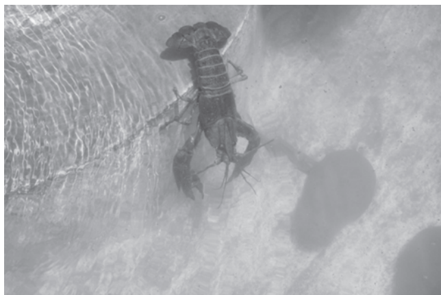
Centro de alevinaje Carlos Manuel de Céspedes donde se desarrolla la cría y exportación de langosta de agua dulce