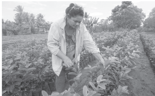
Avanza y continúa desarrollándose la Agricultura Urbana en el municipio