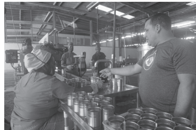
Los trabajadores del Combinado de Cítricos de Contramaestre apuestan a seguir diversificando sus producciones y que cada vez sean mayores para satisfacer la demanda del pueblo

Un pueblo alegre y revolucionario fue lo que vio el presidente de los Consejos de Estado y de Ministros, Miguel Díaz-Canel, en su visita a Contramaestre, territorio con una economía sólida basada principalmente en la agricultura con renglones como el café, el cultivo de caña de azúcar y la crianza de ganado vacuno, ovino, porcino, equino y aves.