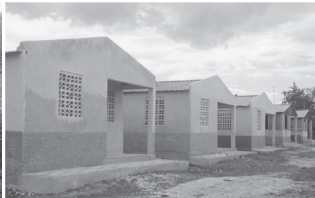
Nuevo asentamiento de viviendas en la zona conocida como El Transformador