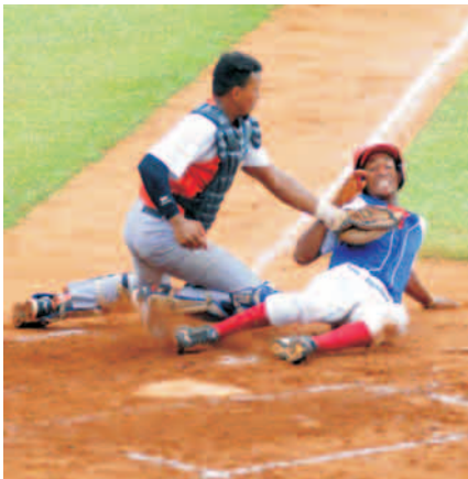
La Serie Provincial de Béisbol 2019 se definirá en el último momento

Así las cosas, todo quedó listo para vivir una definición entre dos de los