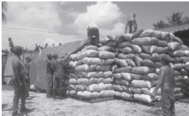
Otro de los renglones económicos del municipio es la fabricación de carbón para la exportación, que en la actualidad presenta problemas con los contenedores

Aunque queda mucho por mejorar, en Contramaestre se respira un aire transformador y de desarrollo, que se revierte en una mejor calidad de vida para sus residentes, a la vez que se hace necesario el apoyo y contribución de todos para que en ese territorio se haga realidad lo expresado recientemente por el presidente cubano cuando recorrió varios centros de interés económico y social del municipio: “he visto un pueblo aguerido, comprometido y además defensor de lo logrado”.