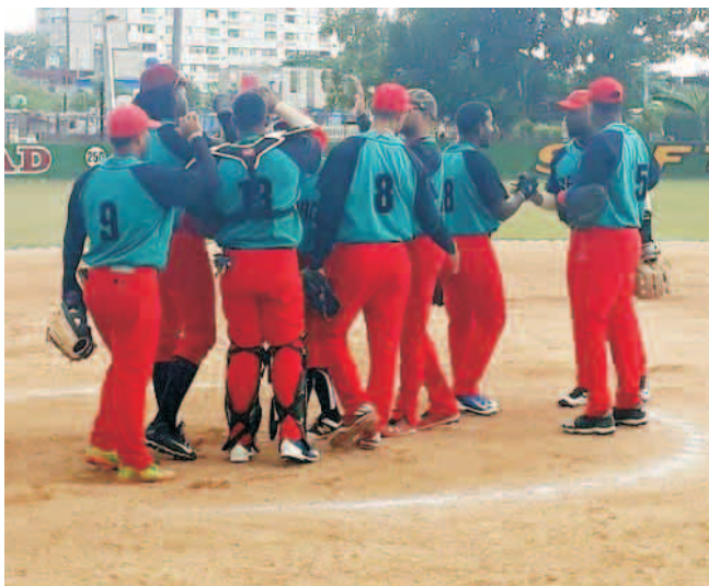
Los santiagueros ganaron el torneo por segunda ocasión consecutiva