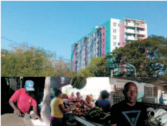
En el 'Antonio Maceo' sus pobladores transforman el entorno

En el caso del edificio 12 plantas manifestó que se está haciendo un trabajo integral, porque se han sustituido todas las tuberías del sótano, un antiguo reclamo de los vecinos debido a los salideros y obstrucciones provocados por su estado