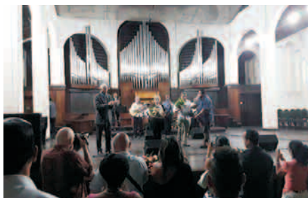
Homenaje a Félix Valera