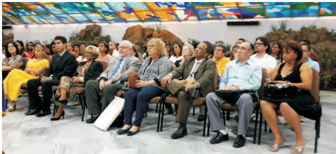
Personalidades de la hipnosis terapéutica en América Latina

Desde 1999 Santiago de Cuba es sede de HipnoSantiago. En esta edición se celebró el vigésimo aniversario del Taller y de la Asociación Panamericana y Caribeña de Hipnosis Terapéutica.