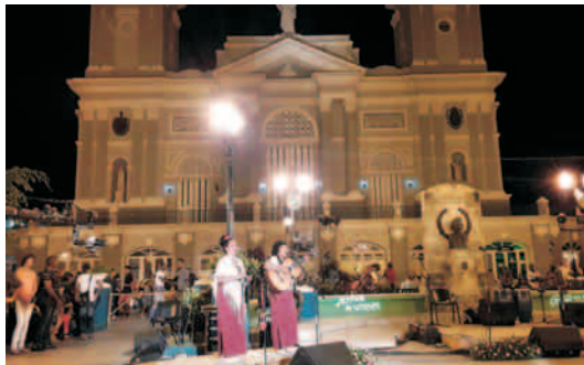
Dúo Voces del Caney

Todavía hay gentes que aseguran que la trova es una manifestación musical en franca decadencia porque no se percatan de su presencia en el panorama cultural de nuestros días. Una cosa es la lamentable actitud mercenaria de quienes prefieren ceder los espacios públicos a exponentes de corrientes musicales marcadas por acentos de mediocidad pero que producen altos dividendos económicos, y otra cosa es decir que la trova de siempre ha disminuido su representatividad social hasta el punto de desaparecer como tal para entonces quedar como un recuerdo. Quienes así piensan debieran de llegar hasta Santiago de Cuba, sede del Festival Pepe Sánchez, para comprobar la plena vitalidad de estas canciones del alma gracias a la presencia de trovadores procedentes de todas las provincias del país, además de los propios músicos santiagueros.