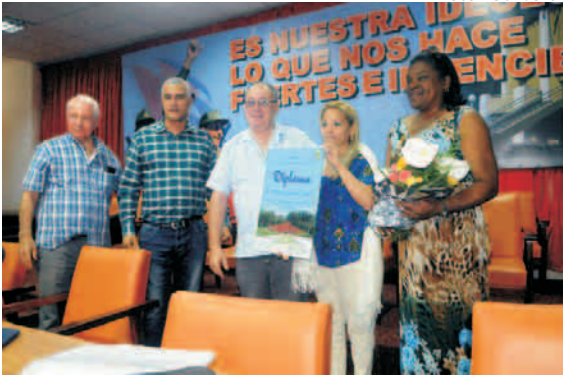
Máximas autoridades del Partido y el Gobierno en Segundo Frente, reciben el reconocimiento por ser el territorio más integral del Plan Turquino

Los participantes en la reunión, presidida por los