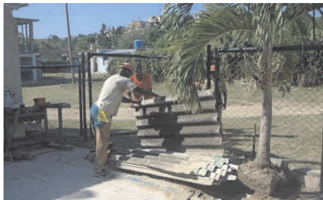
Los moradores del consejo popular Flores trabajan en pos de lograr un barrio más limpio y organizado

Desde octubre de 2018 se ha trabajado en la mejora de más de 100 fachadas de viviendas, aunque la meta es alcanzar más de 400, todas como parte de la reanimación de la calle Santa Ursula, arteria principal de la zona. Se reconstruyó una bodega destruida tras el paso de 'Sandy', y otras tres han sido reparadas.