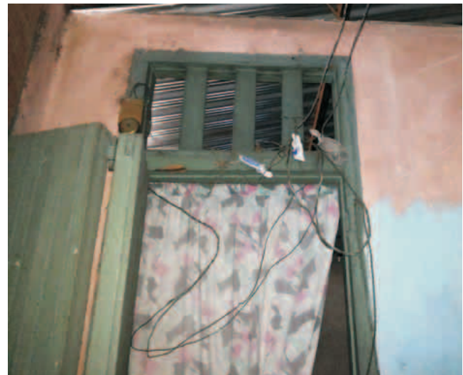
Los cables del techo electrificado

Sin embargo, ojo con las terminaciones de los trabajos. Que el apresuramiento por cumplir un plan no nos ciegue. Que los casos aquí expresados tengan pronta respuesta. Porque, al final de todo, es por y para el pueblo santiaguero que se trabaja y, cómo no, mientras mejor quede, más tiempo durará.