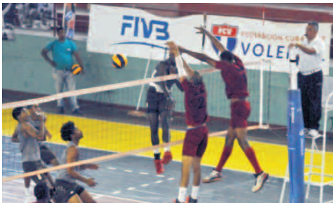
Los indómitos dejaron a Villa Clara sin opciones de retener la corona

Tras el descanso de hoy sábado, está previsto que mañana domingo comience la etapa conclusiva, que se extenderá hasta el martes. Los cuatro primeros buscarán un puesto en el podio de premiaciones, al tiempo que el resto de los equipos pugnarán por los puestos del quinto al octavo. Ambas cuartetas jugarán un Todos contra todos en la que no se tendrán en cuenta los resultados de la fase eliminatoria.