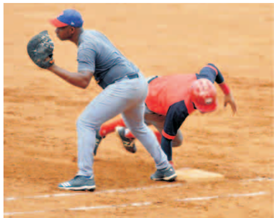
La pelea por el trono de la pelota santiaguera marcha bien apretada

Este viernes comenzarán las terceras subseries con los duelos Segundo Frente-Santiago A, Sub-23-Palma Soriano y San Luis-Songo. En cada caso los primeros comenzarán como locales.