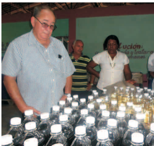
Producción de viña y vino seco en Mella

Sobre la actual zafra, trascendió que el central Julio Antonio Mella presentó -en los últimos 20 días- fallos de tipo industrial, evidenciados en los problemas con el turbo generador, el conductor de bagazo, roturas en la bomba de trasiego y los camiones, así como las carencias en el suministro de bujes de goma; todo esto ha provocado un endeudamiento de unas 2 600 toneladas del endulzante, las cuales tendrán que ser recuperadas paulatinamente antes de que finalice la contienda.