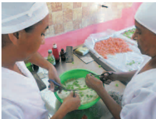
Minindustria "El Sabor"

Momento especial resultó la visita a la sede del proyecto comunitario de teatro "La Colonia", en el cual 25 niños