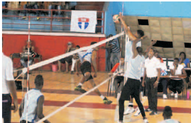
Los santiagueros buscarán regresar al podio del voleibol masculino cubano

Según pudo conocer Sierra Maestra , excepto los jugadores que participan en ligas extranjeras, estarán presente en la lid los más destacados del país. Asimismo, por una cuestión estratégica, los sextetos serán reforzados con atletas de la preselección nacional cuyas provincias no hayan clasificado para el Campeonato.