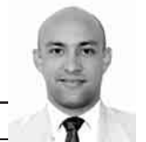
A cargo de: JORGE R. MATOS CABRALES

tiempo-extra-90.blogspot.com @MatosCuba84