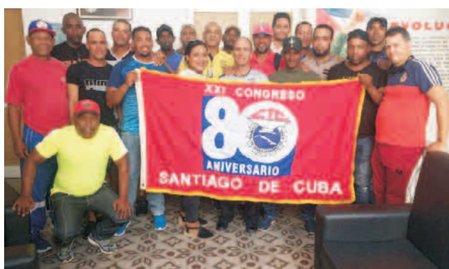
Los campeones representarán a la provincia en el torneo zonal

El equipo de softbol Atlético, cuyos integrantes pertenecen al sindicato de los trabajadores de Energía y Minas, se tituló campeón provincial de la XXIV Copa de Softbol Lázaro Peña tras vencer dos veces (KO de 20x9 y 24x16) al elenco de la Refinería Hermanos Díaz.