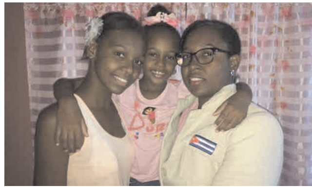
Para la ajedrecista santiaguera, sus dos hijas son su mayor felicidad

-Es, sobre todo, una actitud ante la vida. Aparentemente es un juego, pero detrás de este uno tiene el deseo de ganar, la intención de llegar lejos. Yo sueño con participar algún día en un Mundial. Por eso me sacrifico y estudio durante horas. El ajedrez se parece mucho a la vida. Uno tiene que pensar mucho las cosas que va a hacer. Una mala jugada puede echar a perder una partida y en la vida, una decisión errada también.