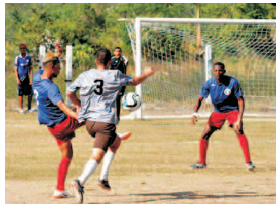
Los Diablos Rojos lideran la Zona Oriental de la 104 Liga Cubana de Fútbol