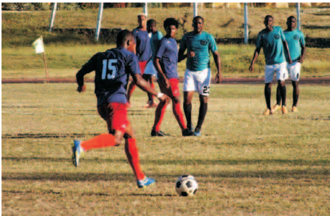
Santiagueros y guantanameros lideran la Zona Oriental de la 104 Liga Cubana de Fútbol