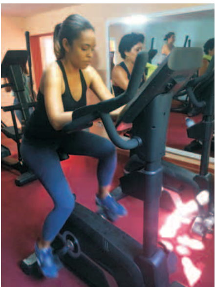
La bicicleta estática es recomendable cuando tengas gripe

En los momentos que aparece la fiebre, que es la principal diferencia sintomática con respecto a un catarro, se debe evitar cualquier ejercicio que implique demasiado esfuerzo y dar al