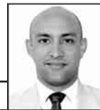
A cargo de: JORGE R. MATOS CABRALES

tiempo-extra-90.blogspot.com @MatosCuba84