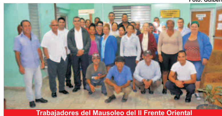
Trabajadores del Mausoleo del II Frente Oriental

"Debemos continuar con la producción de equipos médicos destinados al sector de la salud tan demandado y necesario para el