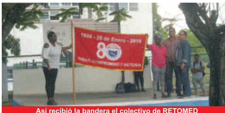
Así recibió la bandera el colectivo de RETOMED

En abril próximo la CTC desarrollará su XXI Congreso, para el cual, seguramente Santiago de Cuba mostrará cuánto se hace aquí por elevar los resultados económicos de la nación, siempre con la participación activa de la clase obrera.