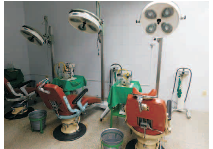
Nuevo salón quirúrgico de la Clínica Estomatológica Mártires del Moncada

Con 27 años de fundada, la institución asistencial está siendo reparada de manera capital, sumándosele una nueva sala de terapia intensiva. Al recorrer el hospital, las autoridades políticas, administrativas y sanita-