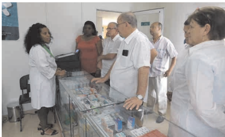
Farmacia internacional ubicada en Ópticas Miramar

Todo lo que se lleva a cabo en este hospital va en función de incrementar servicios para evitar el hacinamiento de los pacientes; y por eso se visitó también una nueva sala de cuidados intermedios, para dar tratamiento diferenciado, que se inauguró el 1ro de enero y ya ha ingresado a 28 pacientes.