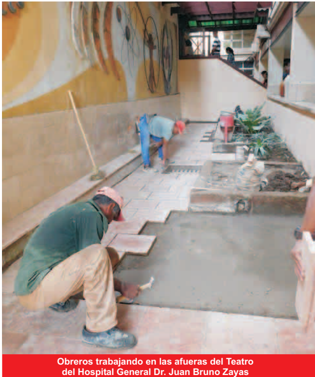
Obreros trabajando en las afueras del Teatro del Hospital General Dr. Juan Bruno Zayas

El 2018 resultó para el sector de la salud en Santiago de Cuba un año de mucho trabajo y logros, tanto en la parte asistencial como en las inversiones. Equipos de moderna tecnología, instituciones restauradas e incluso nuevos locales, ya prestan su servicio a la población que agradece el confort que van adquiriendo paulatinamente los centros de salud del territorio.