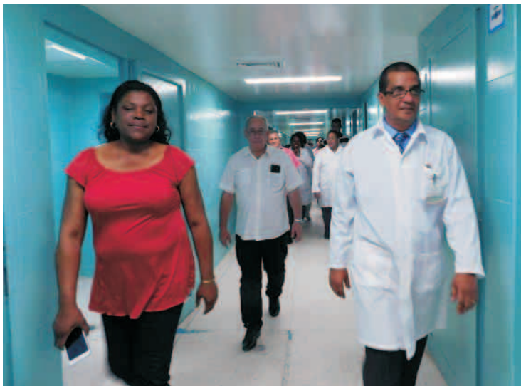
Autoridades de la provincia recorren centros de salud

Para este 2019 son también muchos los retos que se tienen por delante, y es que “la salud pública es un derecho de todas las personas y es responsabilidad del Estado garantizar el acceso, la gratuidad y la calidad de los servicios de atención, protección y recuperación. El Estado, para hacer efectivo este derecho, incluye un sistema de salud a todos los niveles accesible a la población y desarrolla programas de prevención y educación, en los que contribuyen la sociedad y las familias”.