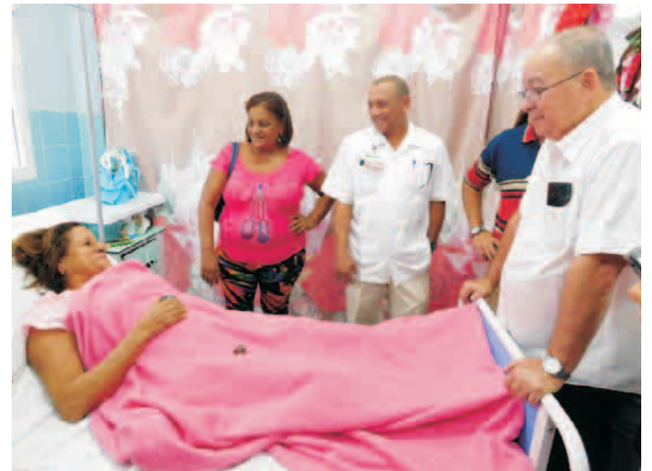
El Primer Secretario del Partido en Santiago de Cuba, intercambió con paciente ingresada en la nueva sala de cuidados intermedios del Hospital Provincial Saturnino Lora

El “Juan Bruno” tiene instalados 77 calentadores solares en su azotea que posibilitan que los pacientes disfruten de agua caliente a la hora del baño. Este fue el primer hospital que implementó las celdas fotovoltaicas, y ahorran un 10% de la energía del centro.