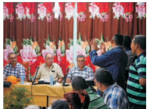
El Primer Secretario del Partido en la provincia analiza los principales indicadores de la zafra azucarera 2019 en el central Julio Antonio Mella

Es favorable que, al igual que el ingenio de Mella, todavía mantienen un plan general positivo, por lo que con un poco de esfuerzo no les será difícil recuperar la deuda de enero.