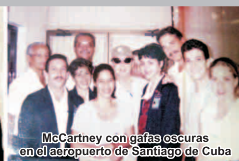
McCartney con gafas oscuras en el aeropuerto de Santiago de Cuba