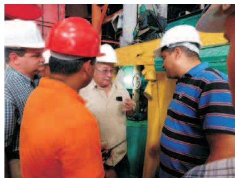
Lázaro Expósito, primer secretario del Partido en Santiago de Cuba, intercambia con trabajadores mientras visitaba el central América Libre de Contramaestre

La situación todavía no es grave ni mucho menos irreversible para los ingenios de San Luis, Contramaestre, Mella y Palma Soriano; aunque el Dos Ríos, de esta última localidad, presenta un panorama mucho más tenso y