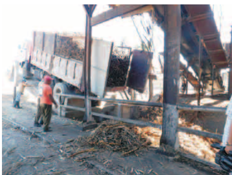
Llegada de la caña al basculador en el central de Contramaestre

Con este panorama, que no es del todo desfavorable gracias a la labor de los agroindustriales en el mes de diciembre, solo queda hacerse eco de las indicaciones de las autoridades de la provincia: trabajar más, trabajar duro, y trabajar mejor; para que esos buenos resultados que aún endulzan la zafra santiaguera perduren hasta el final de la campaña.