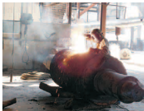
Reparación de una maza, dispositivo de los molinos, encargado de extraer el jugo a la caña en el "América Libre"

El contexto de "Paquito" no ha sido el mejor por varias interrupciones, y así y todo, aspiran a cerrar este primer mes del año con 1 800 ton de azúcar. Actualmente tienen un rendimiento industrial sobre 8, que debe continuar aumentando; y aprovechan el rendimiento potencial de la caña (RPC) al 78%.