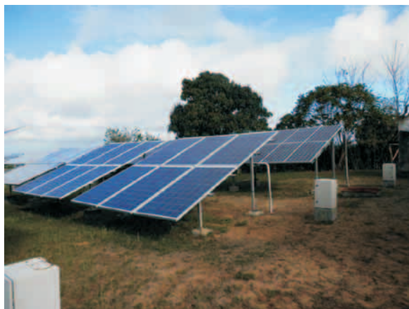
Central fotovoltaica ubicada en Santa María de Loreto (Songo-La Maya) donde se han beneficiado cientos de pobladores durante 21 años

Centro de Información y Gestión Tecnológica: Trabajó en más de 10 proyectos relacionados con programas nacionales, como es el caso del Programa Desastrológica, subordinado al Cenais, en el que tributaron un proyecto relacionado a un entorno virtual de enseñanza y aprendizaje. También confeccionaron una página web del Corredor Biológico del Caribe, recopilando toda la base de datos de información del proyecto.