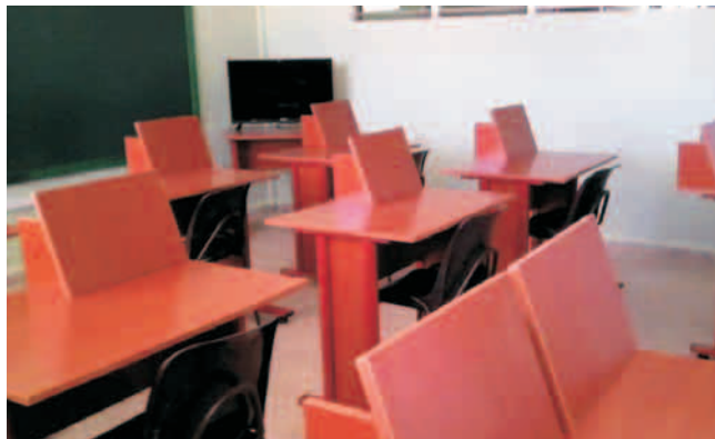
Las aulas están dotadas de nuevo equipamiento y mobiliario

La escuela alojará hasta 120 niños de las provincias orientales con discapacidades físico-motoras y otras asociadas, desde preescolar hasta noveno grado. De estos, 74, entre hembras y