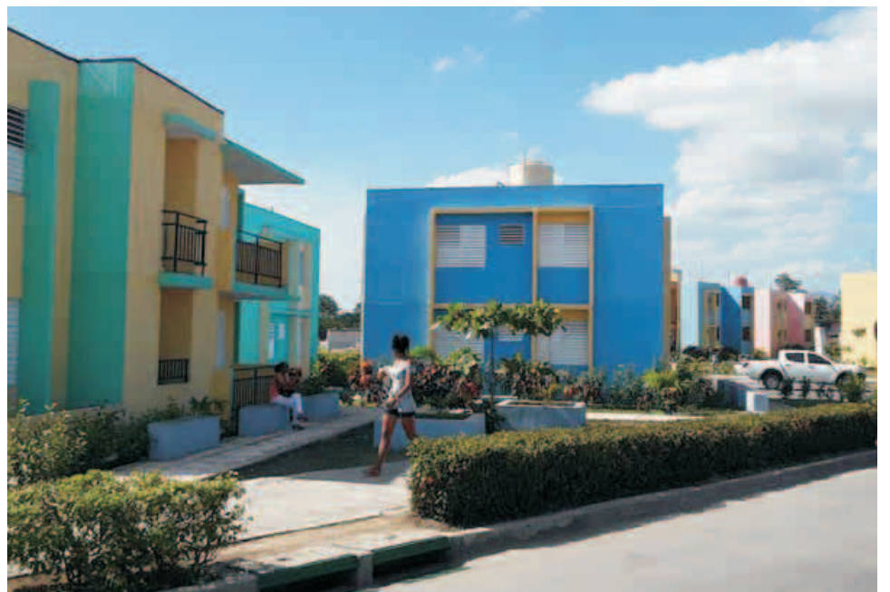
Con las más de 5 000 viviendas culminadas en la provincia continuó también el programa de transformación de la barriada de San Pedrito

En medio de este sintetizado recuento, Expósito Canto acaba de precisar que lejos de dormirse en los laureles, los santiagueros se consagrarán en este 2019 al desarrollo económico, la producción de alimentos, la satisfacción de necesidades de la población y a un grupo de importantes inversiones, que contribuirán a distinguir aún más a la Ciudad Héroe de la República de Cuba, y a la provincia en general.