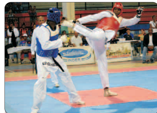
El equipo de taekwondo de la Primera Categoría fue elegido como el mejor del año