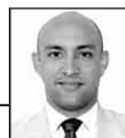
A cargo de: JORGE R. MATOS CABRALES

tiempo-extra-90.blogspot.com @MatosCuba84