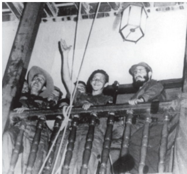
Fidel y Raúl en el balcón del Ayuntamiento de Santiago de Cuba el 1 de enero de 1959

La Caravana de la Libertad logró que las importantes fuerzas militares del Puesto de Mando de Operaciones en Bayamo y la guarnición de la ciudad se sumaran a la debacle batistiana. Aquí, el 3 de enero, se encuentran Fidel y el comandante Camilo Cienfuegos, quien tras neutralizar el Cuartel General del Ejército en Columbia, viajó hasta allí e informó sobre el cumplimiento de la misión asignada. Ya entonces todas las guarniciones militares del país se habían rendido o sumado a la