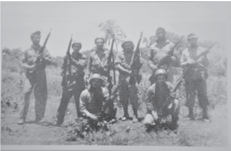
Tropas rebeldes preparadas para atacar Santiago de Cuba

La inminencia del descalabro del poder batistiano condujo a que el alto mando castrense acudiera a realizar conversaciones con la jefatura del ejército popular, de esta manera el 28 de diciembre se efectuó en el demolido central Oriente una entrevista entre el general Cantillo, el coronel