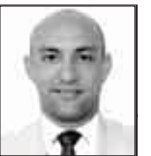
A cargo de: JORGE R. MATOS CABRALES

tiempo-extra-90.blogspot.com @MatosCuba84