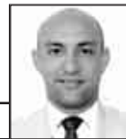
A cargo de: JORGE R. MATOS CABRALES

tiempo-extra-90.blogspot.com @MatosCuba84