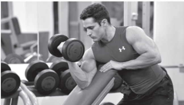
Los bíceps son de los músculos más trabajados por los amantes al fitness

Ahora bien, cuando llega el momento de la verdad y cogemos las mancuernas o la barra, cabría preguntarnos: ¿Estaremos entrenando bien nuestros bíceps? Si no estás contento con el