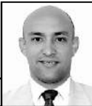
A cargo de: JORGE R. MATOS CABRALES