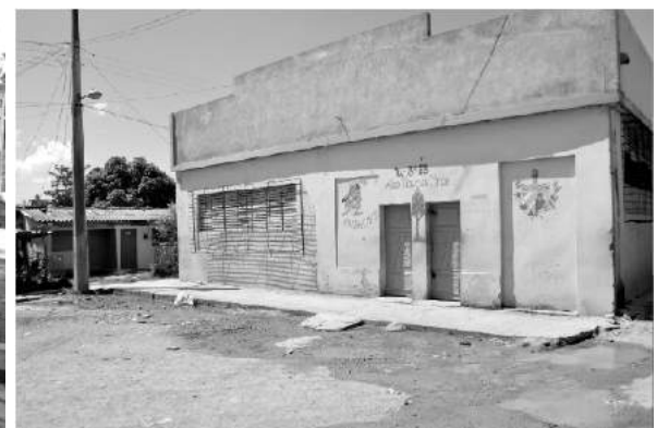
A la izquierda la Farmacia y a la derecha el Supermercado, ambos en sus alrededores con aguas albañales