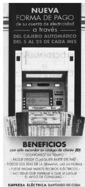
Plegables de la Oficina Comercial de la Empresa Eléctrica Santiago de Cuba sobre las nuevas formas de pago