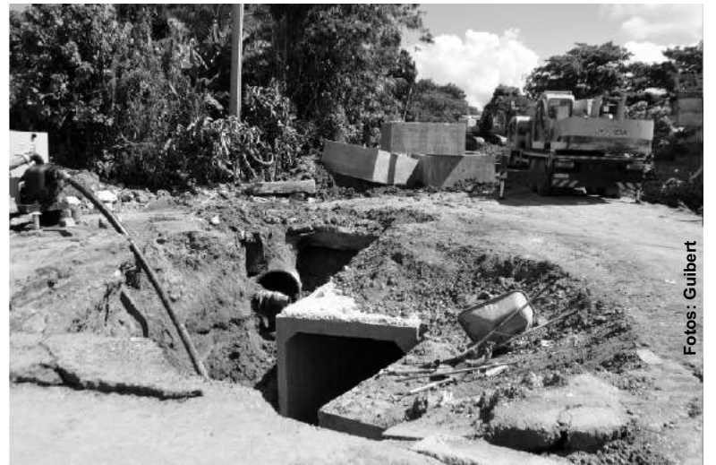
Acciones que se realizan en el aliviadero del río San Pablo

“Accedí a que se picara y descubrimos que debajo de mi