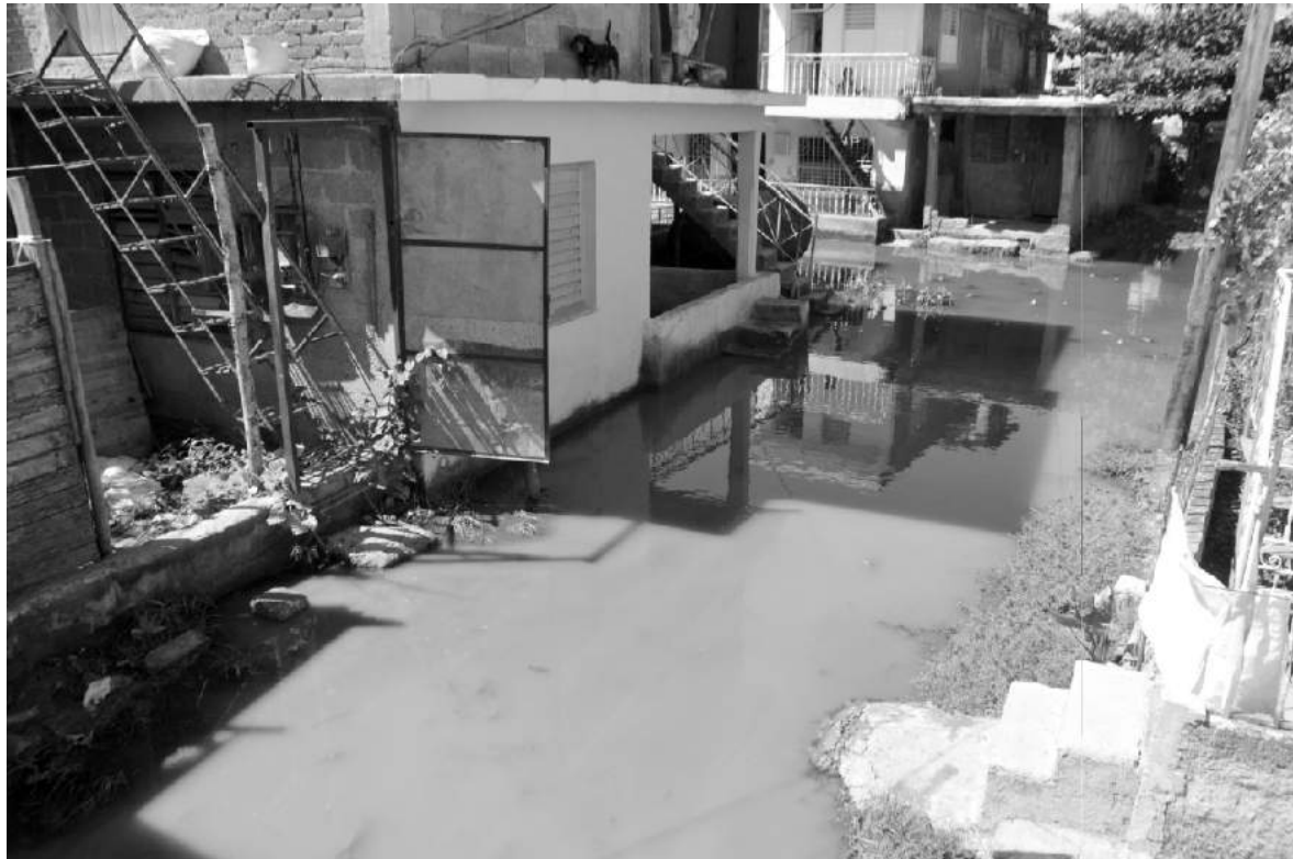
El agua albañal acumulada en el pasaje impide la entrada y salida de las viviendas

Este mismo escenario lo sufren los vecinos de calle 4ta y de Pasaje 13, 11, 7 y 1, viéndose dañados un gran número de pobladores.