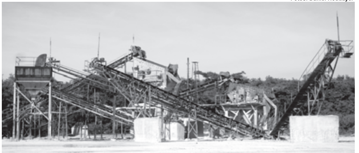
Maquinaria para el proceso de fabricación de materiales de la construcción en El Mucaral. Santiago de Cuba