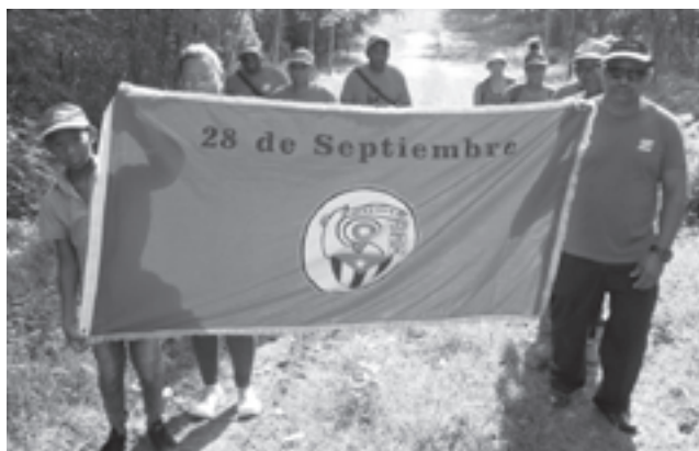
Los delegados al 9no Congreso suben la Ruta a Mícará