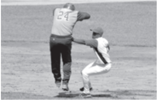
El duelo entre santiagueros y espirituanos debe ser bien cerrado

La mesa está servida señores. La segunda fase está ahí, a dos victorias, y para eso, tenemos que conquistar el Yayabo. Nos vemos en el “Guillermon”.