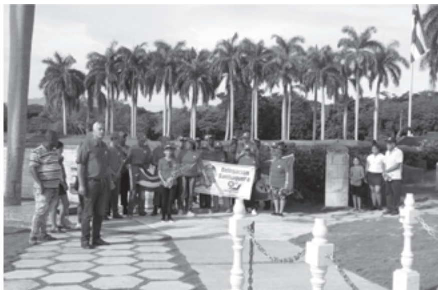
Delegados visitan el Mausoleo

10:30 a.m. En la cima, el paisaje es maravilloso. Cada palma tiene su nombre, el de un combatiente del II Frente Oriental. Desde allí, se reconoce a lo lejos el Mausoleo. El momento en que los delegados se dan cuenta de que subieron “todo eso” en tan poco tiempo y con tan buen ánimo es jubiloso. El entusiasmo desborda a un grupo al que le sobra esta cualidad.