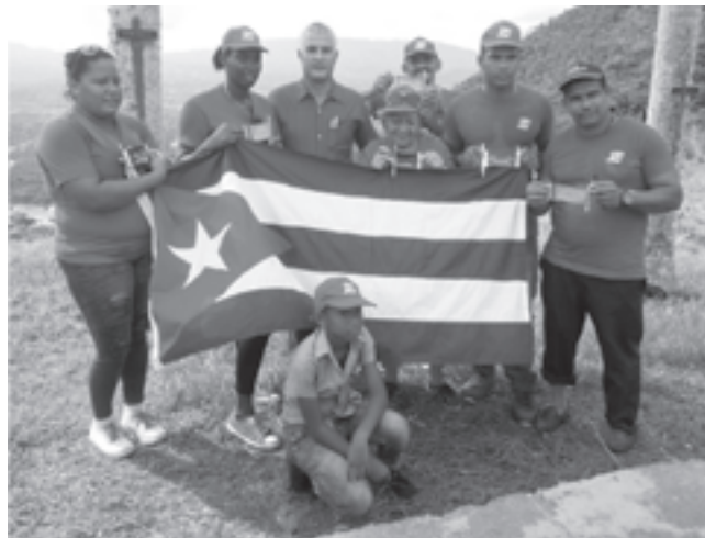
En la cima con el Primer Secretario del Partido en Segundo Frente