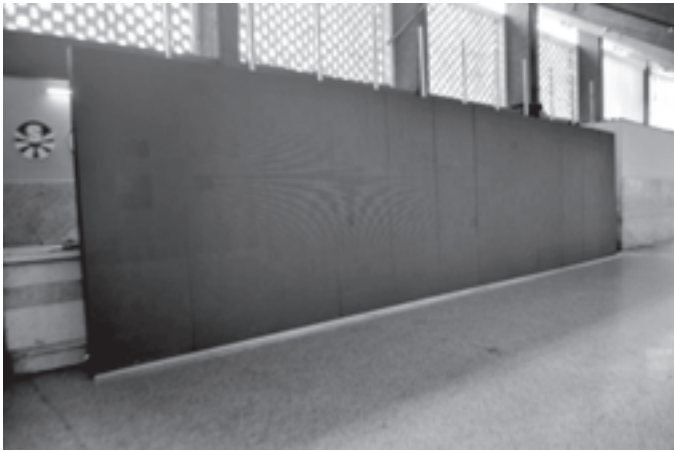
Ya comenzó el ensamblaje de los paneles LED

En el ‘Maceo’ se trabaja actualmente en el acondicionamiento del terreno para luego comenzar con el montaje de la cancha sintética. Esta es una obra que la Fifa verifica todas las semanas, y no solo contará con la ubicación del terreno, sino que además llevará otra pantalla digital y la revitalización del alumbrado artificial.