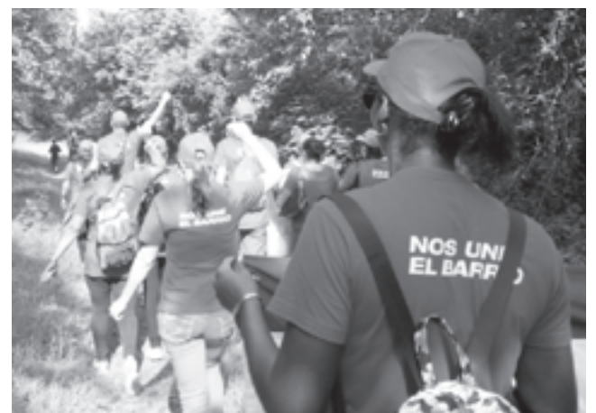
Ruta 9no Congreso, Segundo Frente, Santiago de Cuba

12:00 m. Visita al Complejo Histórico. Los cambios, para