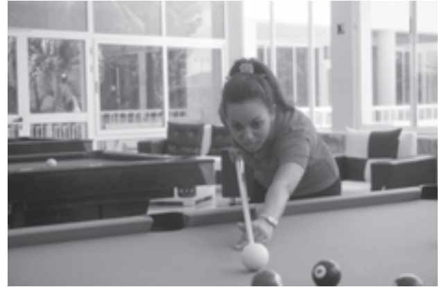
Sala de Juegos

“En funcionamiento también dos tiendas Caracol que comercializan, fundamentalmente, artículos de piscina; el Bar Santiago especializado en tapas, y cotelería de alto estándar, equipado con tecnología del primer mundo; un restaurante buffet pero que ahora está prestando servicio “a la carta” aunque para el mes entrante debe comenzar a cumplir su objeto social.