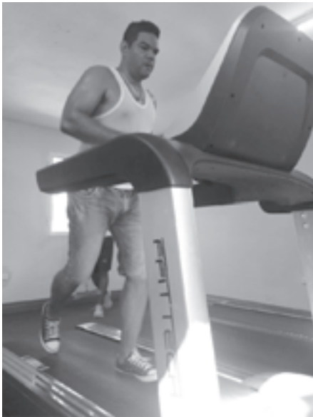
La estera eléctrica es uno de los aparatos más utilizados

Ahora comienza otra tarea para los trabajadores y usuarios del "Fuerza y Vida": cuidar y mantener lo que tanto esfuerzo cuesta. Solo así podremos disfrutar por años de esta nueva joya del fisiculturismo en Santiago de Cuba.