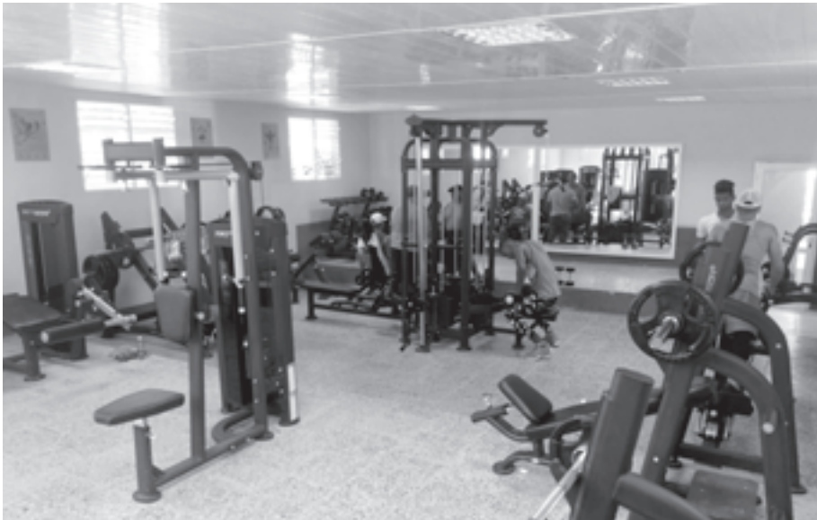
El gimnasio cuenta con equipos de última generación

El entrenador explicó también que el gym ,