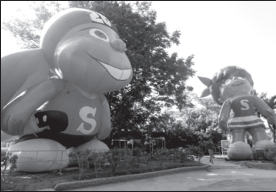
En este verano Chaguito, la mascota de la ciudad, creada por el artista santiaguero Isauro Salas, no se quedó solo, llegó su compañera Chaguita, para dar nuevos aires a cada espacio