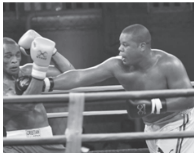
Larduet aportó la sexta medalla de oro al boxeo cubano

Cierran intensas y discutidas jornadas de competencias donde los santiagueros, una vez más ratificaron a su pueblo que también iban por más.