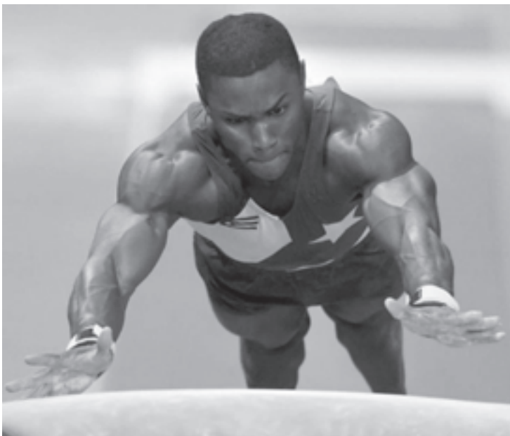
Manrique lideró la gimnasia artística