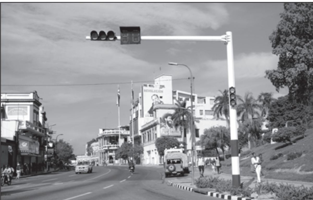
El Centro Provincial de Ingeniería del Tránsito, trabajó en el montaje de nuevos pedestales para algunos semáforos de la cabecera provincial