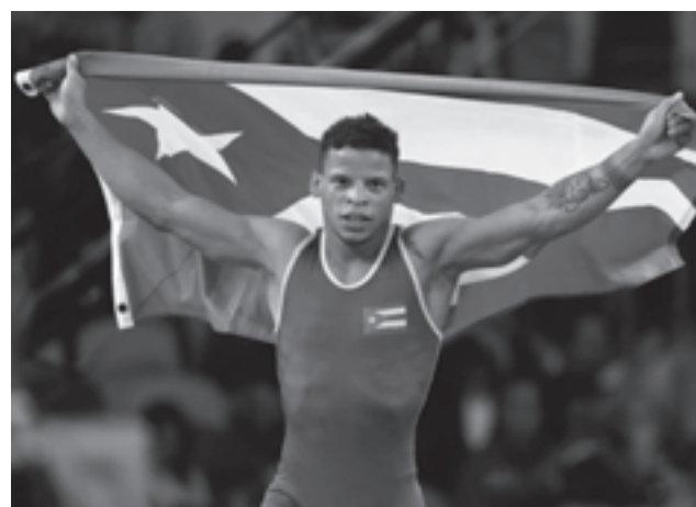
Borrero ratificó su supremacía