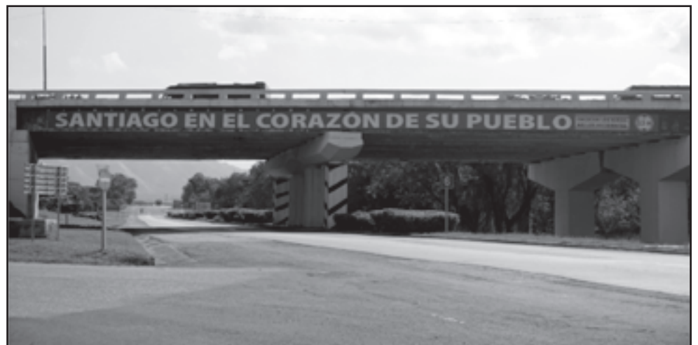
En producción cooperada de varias entidades, entre estas Geocuba e Ingeniería del Tránsito se hace visible esta imagen en algunos puentes ubicados en la entrada de la ciudad. Este es en San Juan