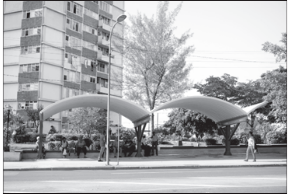
En el mes de junio se inició la ubicación de un nuevo diseño de parada, el cual resulta novedoso, pues además de brindar una imagen diferente, permite protegernos del fuerte sol de este verano. Ya podemos disfrutar de su beneficio en Garzón y la parada de El Algarrobo, en la carretera de Siboney.