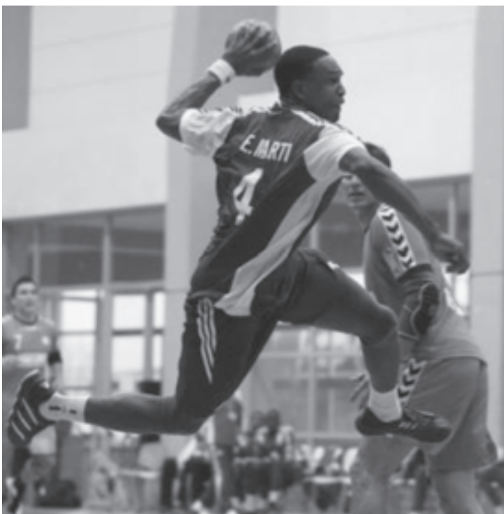
También los santiagueros devolvieron a la cima al balonmano cubano