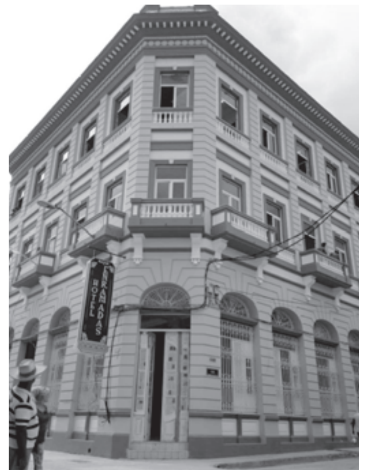
Hotel Enramadas en la arteria del propio nombre muy próximo a la Alameda