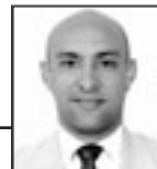
A cargo de: JORGE R. MATOS CABRALES