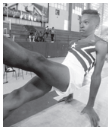
“Mi mayor sueño es representar a Cuba en competencias internacionales”, confesó el joven atleta

Se trata de un joven campeón, de hablar pausado y sencillo en sus declaraciones, pero que no duda en