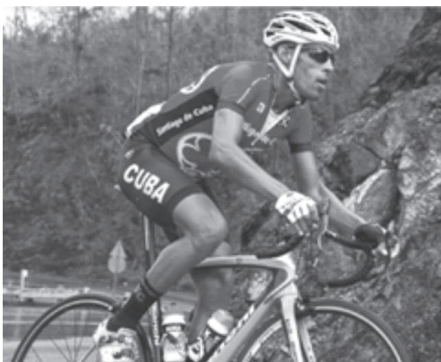
“Tato” ganó el bronce en la contrarreloj del ciclismo de ruta

Se espera que los gimnastas artísticos cubanos sean de los primeros en aportar preseas a la Mayor de las Antillas, ya que su evento está programado para empezar el viernes 20, en el Centro de Eventos Puertas de Oro. Veremos entonces, hasta dónde podrá brillar Manrique.