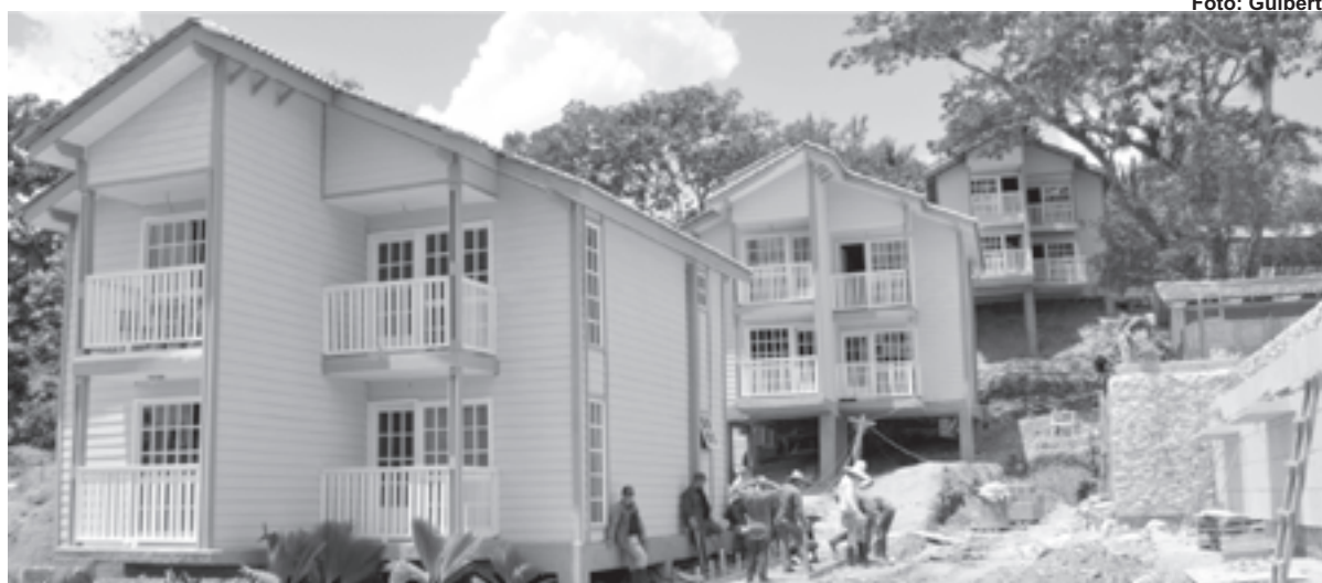
Avanza construcción del nuevo hotel

Por estos días, en el histórico municipio de Segundo Frente, se viven intensas jornadas de trabajo para consolidar el quehacer económico, social y político de esa porción oriental.