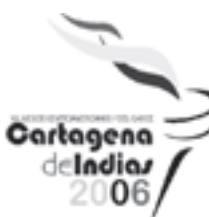
Cartagen de Indias '06 44-20-11