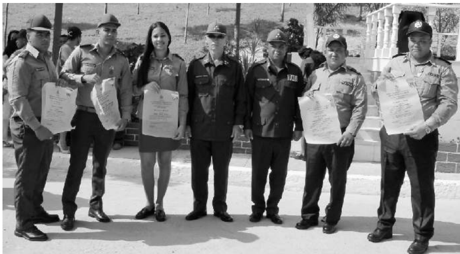
Los cinco Títulos de Oro junto al Jefe del Minint en la provincia y al presidente de la Comisión de exámenes estatales y defensa de trabajos de diploma

Más de 100 nuevos oficiales de las provincias orientales recibieron su título de graduados en diferentes especialidades del Ministerio del Interior, en el acto de graduación efectuado como saludo al 57 Aniversario del Minint, y en el contexto de la preparación del territorio indómito para celebrar los 65 años del asalto al Cuartel Moncada.